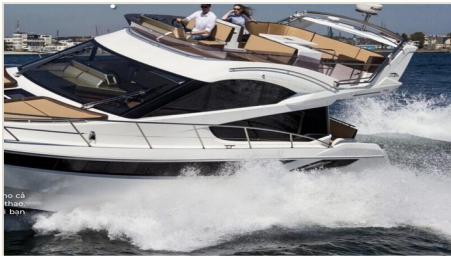
GALEON 420 FLY